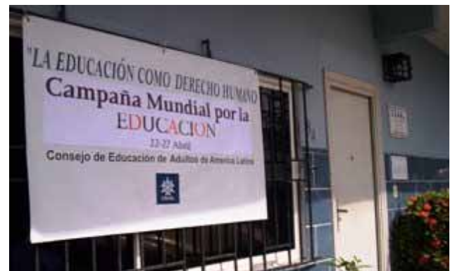
Fachada de la Sede de la Secretaría General del CEAAL en Panamá, ubicada en una de las principales avenidas de la capital, que se une a la CME.

¿Cómo hacerles entender que no podemos seguir encerrando la educación en el círculo vicioso de la politiquería, la inequidad, la burocratización, la ausencia de calidad, y que el sistema colapsa cada vez más? ¿Aprenderán la lección?