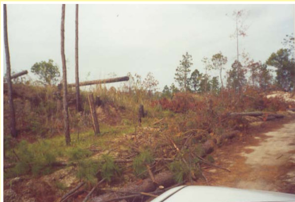
Área afectada por la Plaga Forestal

Sensibilización e información a la población sobre su situación de riesgo para que realicen actividades que contribuyan a prevenir desastres.