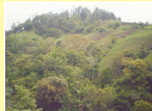
Deslizamiento El Bramadero